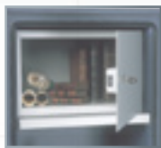
Equipements intérieurs (en partant de la gauche) : tablette, armoire à clé